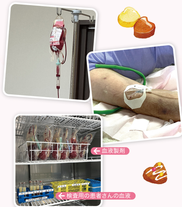
血液製剤専用保冷庫